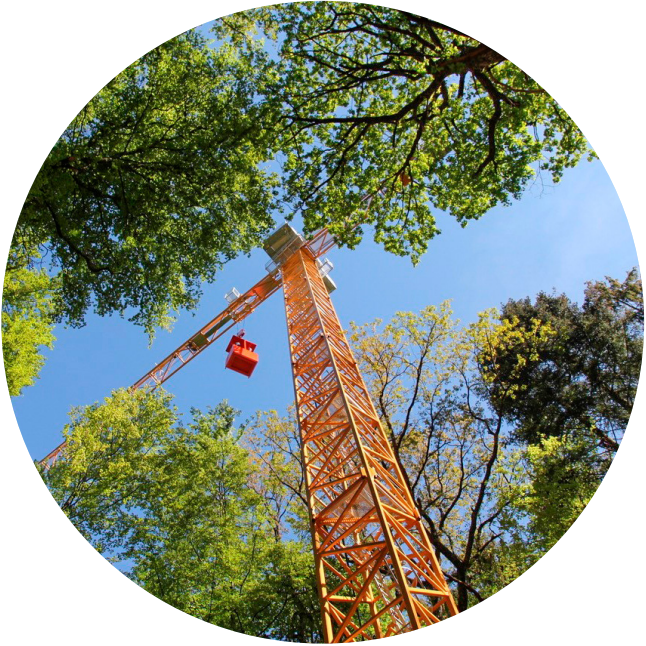
«Swiss Canopy Crane II» im Hölsteiner Wald.